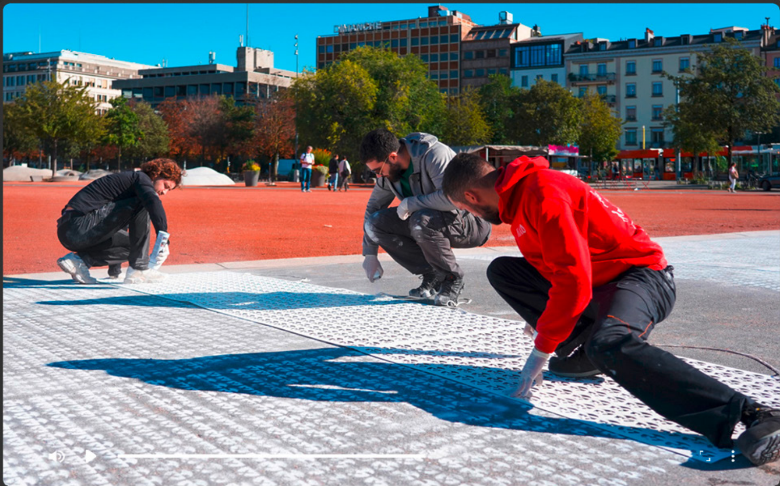
LA CHANCELLERIE DE L'ETAT DE GENÈVE CAMPAGNE DE SENSIBILISATION AU VOTE – CLEAN TAG